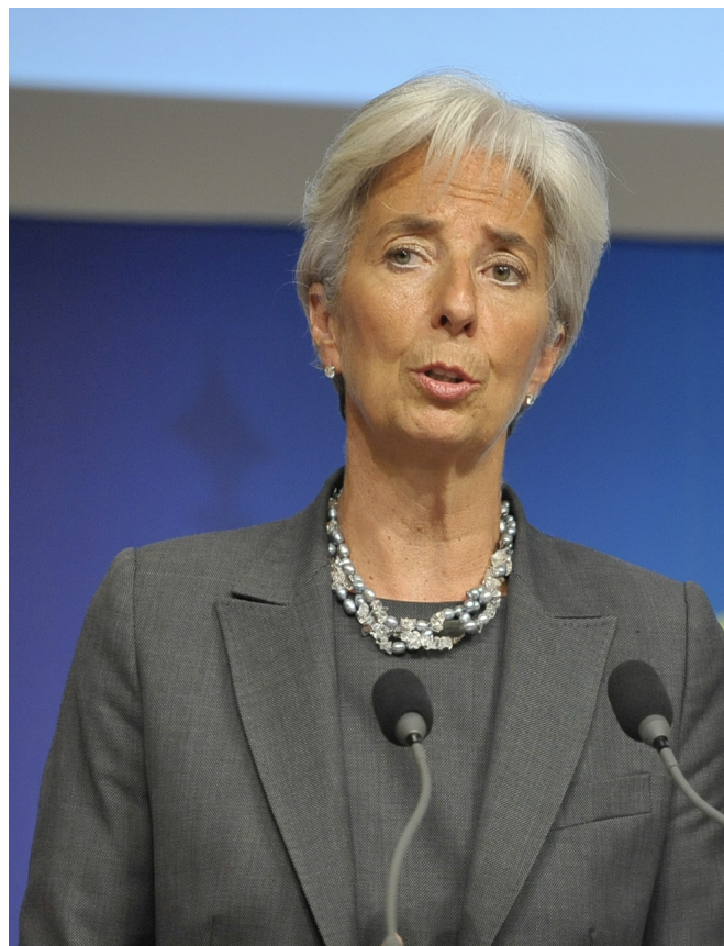
Christine Lagarde, e del vicepresidente de Guindos.