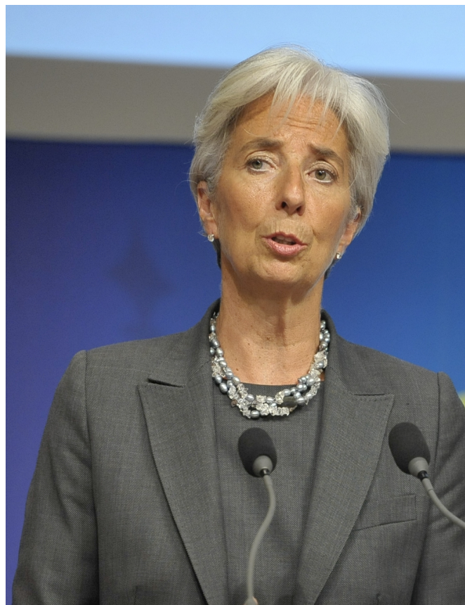
L'intervento del membro della Banca centrale europea Holzmann.